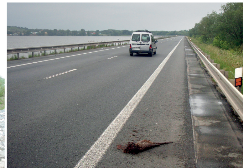
Hráz horní Novomlýnské nádrže je nejhorším místem v ČR. Ročně zde uhynie několik vyder, protože hráz lze překonat jen po silnici Brno–Videň. Vydry zde často přecházejí mezi nádržemi, aby putovaly po řece Dyji či migrovaly do povodí Svratky a Jihlavy.

ve městech svedeny do kolmých stěn, a v kombinaci s příčnými překážkami (zejména jezy) jsou pak toky neprůchozí a vydry musí tyto překážky obcházet, často mimo hlavní tok po přítocích či po souši, a hynou na silnicích daleko od původní překážky na toku.