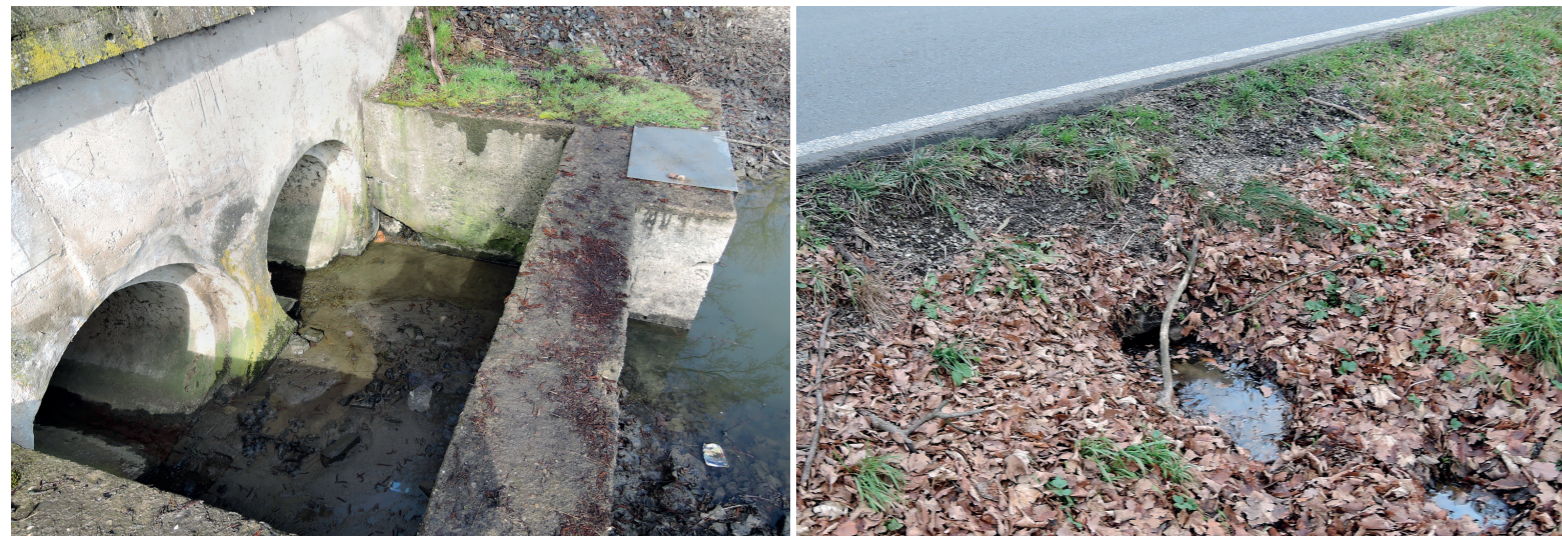
Silnice po hrázích rybníků jsou problém v krajině. Výpustní zařízení či sdružený objekt bývají pro vydry neprůchozí a řešení je složité. Většinou lze najít u bezpečnostního přepadu místo pro schůdky či rampu, po které vydry bezpečně přejdou z toku na rybník.