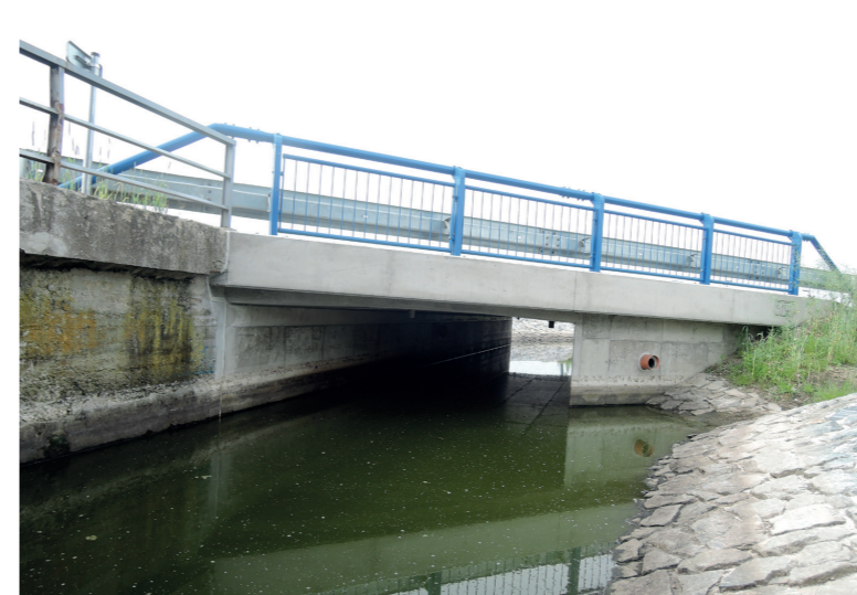
Absence břehů a voda od opěry k opěře jsou častý problém mostů. Malá výška či rychlý proud situaci ještě více komplikují. Řešením je instalace dřevěných lávek nebo betonových lavic při stěnách mostu.

příčin, proč vydry propustek nepoužívají: rozměrově malé propustky, sedimenty ucpané propustky, stojící voda v propustcích a neprůchozí usazovací nádrže na ústí do propustku. Nejčastěji průchozí jsou hráze rybníků. U velkého množství hrází rybníků chybí bezpečnostní přepad a hráz rybníka se silnicí tvoří nebezpečnou bariéru. Pokud bezpečnostní přepad existuje, je často konstruován tak, že je pro vydry průchozí nebo je možné jej jednoduše zprůchodnit. Samotné výpustní zařízení není většinou možné zprůchodnit. Velmi komplikované situace vznikají tam, kde toky protékají intravilány měst. V rámci protipovodňových úprav jsou toky